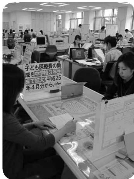
▲気軽に役場窓口へ