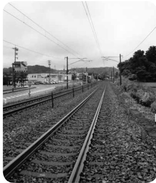
▲ここに駅があれば