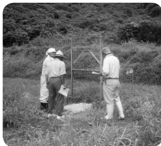
▲1頭でも多くの捕獲を

保護区であってもイノシシに限り捕獲許可を取れば、おりの捕獲は可能で、現在も取り組んでいる。 銃の使用は来園者や地域住民に危険が及ぶ恐れもあり、困難である。 特に被害の多い地区には電気柵の設置やおりの増設を進めていく。