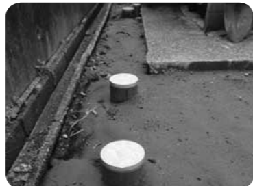
▲早期の切り替えを

Q 環境整備向上へ、早期接続の対策は。 A 広報などで呼びかけるとともに、地元区長と連携をとりながら接続促進を図りたい。