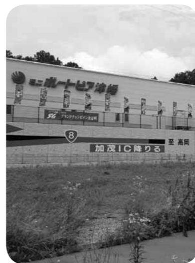
▲オープンしたミニボートピア