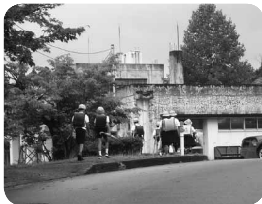
▲放課後も安心して