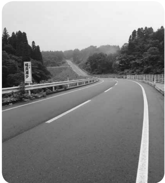
▲今後の進み具合は？