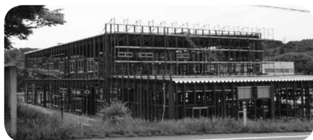
▲建設中の工場（旭山工業団地）

平成16年に20年後を想定した都市計画マスタープランが策定された。中間となる27年の推計人口は4万1900人となっているが、現在の状況では大きく下回ることが予想される。早急に定住促進を図り、人口流出を防ぐ上でも魅力ある定住促進助成制度を創設せよ。さらに企業誘致に力を入れ、地元雇用を創出せよ。