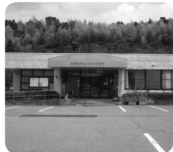
▲避難所となる公民館

災害時の公民館は避難所として重要であるが、まだ機能は十分とは言えない。備品の確保、食糧、飲料水の備蓄など、不測の事態に備えた体制づくりが必要である。今後の整備計画を問う。