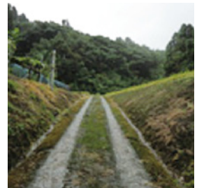
▲この先に椀かせの穴

その昔、村人がお祭りや結婚式などでご膳やお椀が必要なときに、前の日の夕方にこの穴をお願いしておくと、次の日必ず穴の前に出してありました。