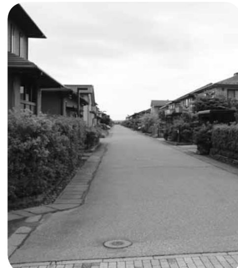
▲スッキリした街並み（井上の荘）

津幡市政に向け、優良宅地と企業誘致のための用地の整備を図るなど、総合的な都市計画を立案せよ。また、津幡丘陵公園地に大型観覧車の設置を検討し、幸せがあり喜びがあり楽しみがあるまちづくりを目指せ。