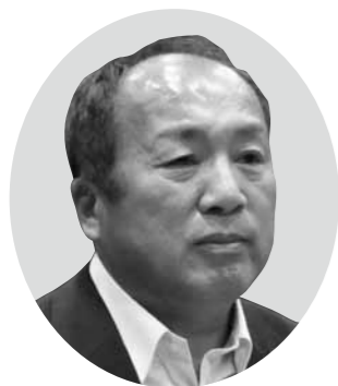
荒井 克 議員