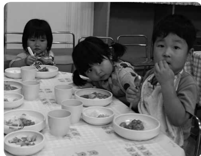
▲子どもは未来の宝