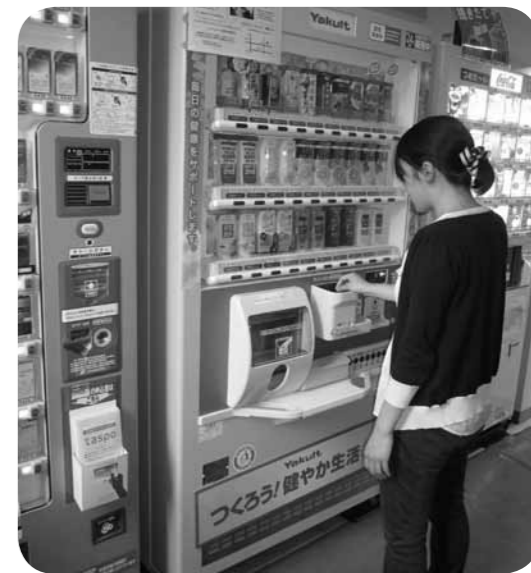
▲街角の見張り役に

津幡駅では自転車の盗難が平成24年に63件発生し、公園ではトイレや遊具などへのいたずらも多く、防犯カメラの設置を計画している。 防犯カメラ付き自動販売機の設置は、今後の自動販売機設置の公募の際に検討したい。