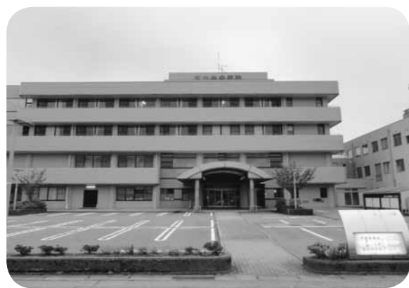
▲ピロリ菌外来を（河北中央病院）

ピロリ菌検査無料クーポン券の発行は、町医師会や関係機関からの意見を聞き、対象者や自己負担などを含め、今後検討したい。 ピロリ菌外来の開設は、町の胃がん検診で、ピロリ菌検査の導入が決定した段階で検討する。