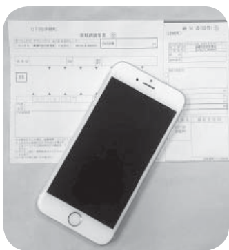
▲いつでもどこでも

平成30年度から新たにスマートフォンを利用しての公金収納サービスを開始し、町税の収納対策を強化する。