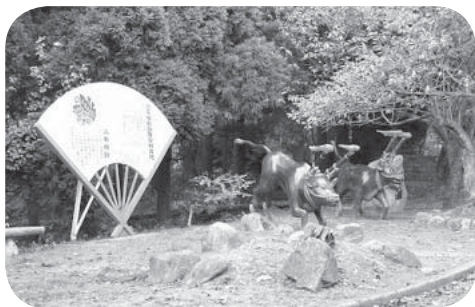
戦いの記憶を観光に