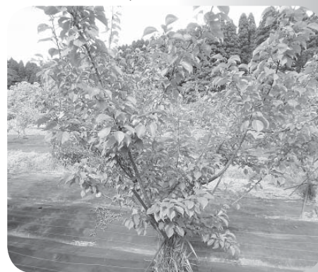
▲花も実も楽しみやね

体験型観光交流公園の植栽事業に使われるアンズの育苗を継続し、またアンズを利用した特産品の開発を委託する。