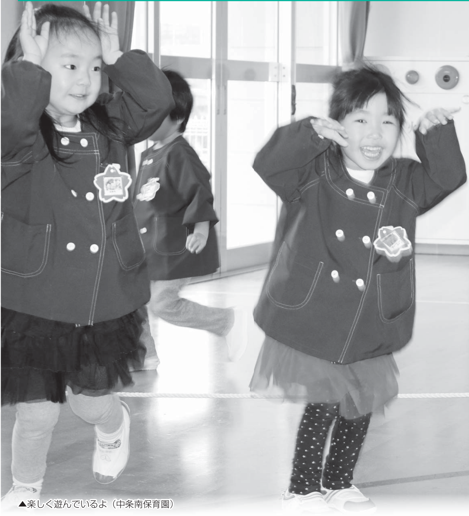
▲楽しく遊んでいるよ（中条南保育園）