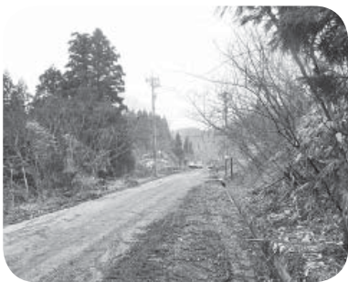
▶体験型観光交流公園 アクセス道路を整備

町税の増収施策は、定住人口の増加と企業誘致の推進、未納解消に向け、積極的に関連事業の実施を図りたい。今後も安定した財政運営に努めつつ、各事業の推進を図っていく。