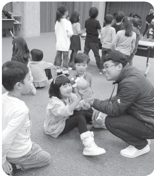
▲進むグローバル教育