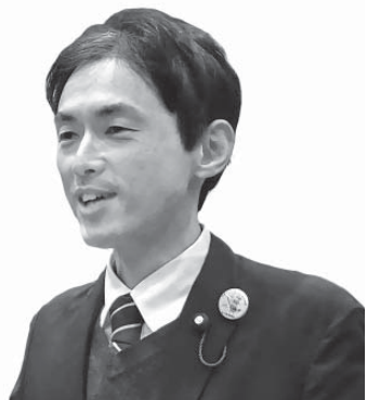
竹内 竜也 議員