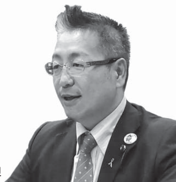
森川 章 議員