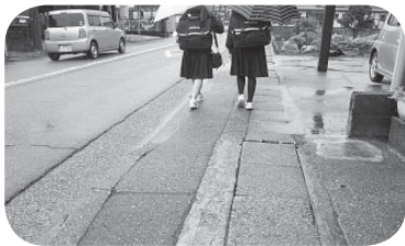
▲歩きやすくなるね

町通学路交通安全全プログラムによる合同点検結果に基づき、歩道などを整備し、通学路の安全確保を図る。