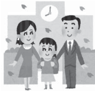
▲うれしい入学式を

平成28年度に就学援助制度の見直しを行い、29年度の中学校入学者を対象に新入学学用品費を入学前に給付した。 小学校入学者の前倒し支給は、認定の方法などを含めて検討を重ねている。