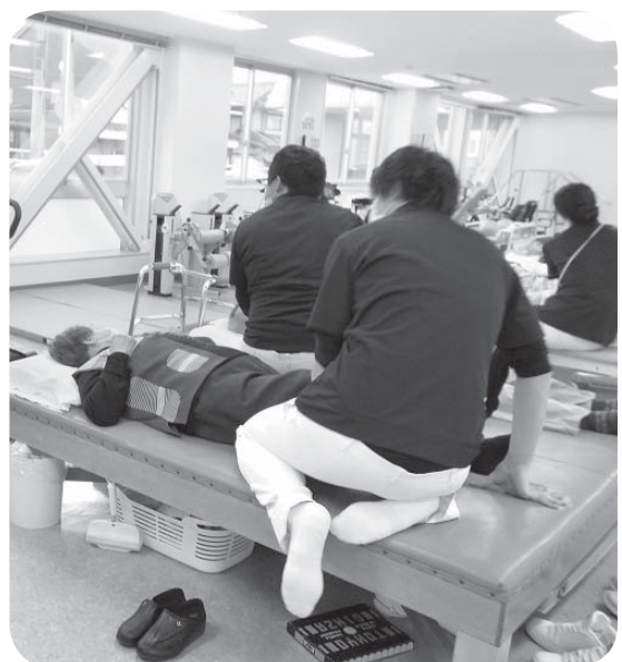
▲リハビリで元気回復