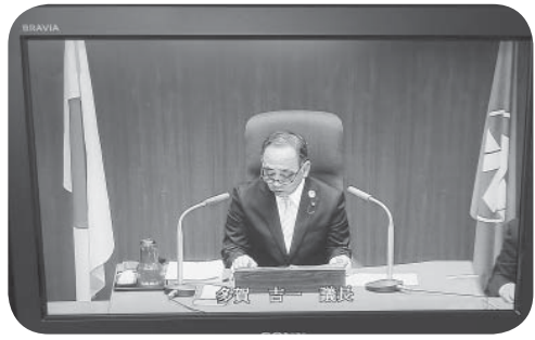
▶開かれた議会を目指して