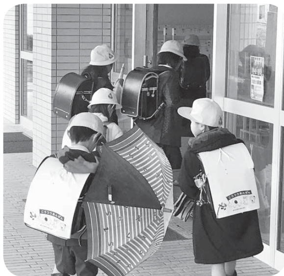
▲ランドセルを背負って

入学前支給が実現されれば、入学準備に必要なランドセルなどの費用に充てられ、保護者にとっては一時的な出費を抑えることができる。早期の実現を求む。