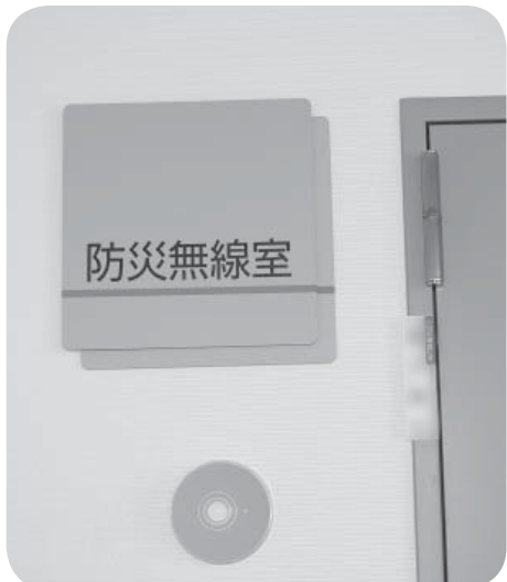
▲早い情報で安心を