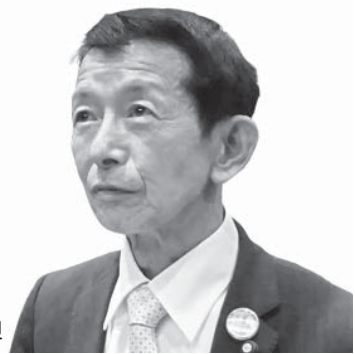
西村 稔 議員

一般質問とは、議員が町政全般について町長など執行機関に考えや方針を問うものです。制限時間は1人30分以内で、一問一答で行われます。