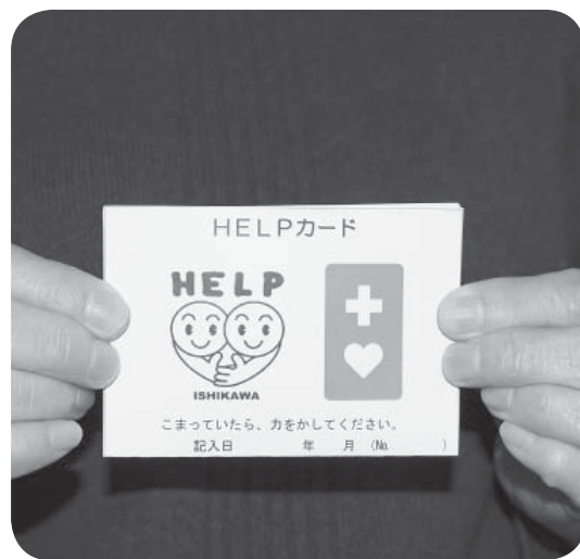
▲カードで支え合い

東京都が発案したヘルプマークが分かりやすいデザインで、これを活用したカードを標準様式化する動きが広がっている。この動きを捉え、交付事業をどう進めるのか。