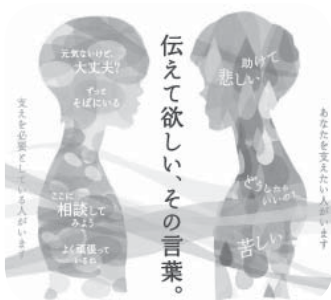
▲毎年3月は自殺対策強化月間