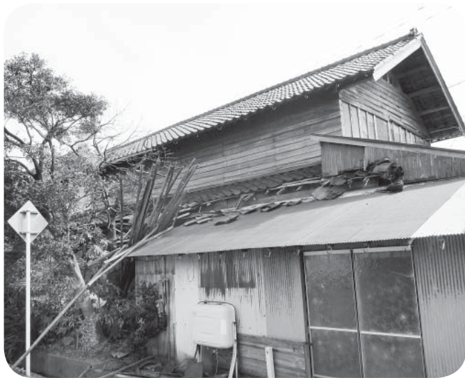
▲空き家対策をどう進めるか

経済的理由で所有者が 解体費用を出せない場合、 町が中心となって地元区 と跡地の有効利用につい て協議し、解決策の助言 ができないか考えている。 解体費用に関する補助 制度は、先進自治体の制 度を参考に、制定を目指 していく。