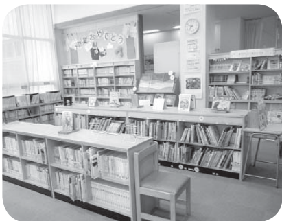
▲読みたい本が見つかるよ

新たに学校図書館システムを導入し、学校図書館と町立図書館をつなぎ、利便性を図る。 また、図書貸出カードのデザインも一新する。