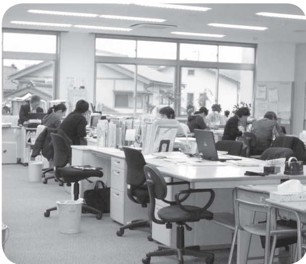
▲職員室で仕事をする先生方

校務支援システムの導入による業務の効率化、部活動の適切な活動など、教職員の長時間勤務の解消に向けた取り組みを着実に推進する。