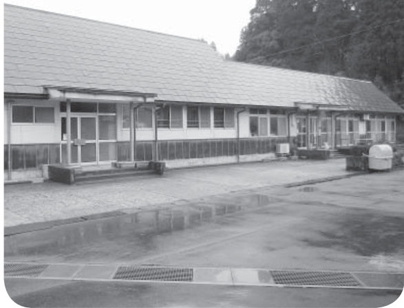
▲保育環境の整備を（萩坂保育園）

Q 高齢者宅の屋根雪下ろしと除雪対策は。 A 地域住民による生活支援体制の構築を目指す。