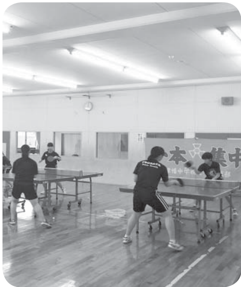
▲大会に向けて一本集中!