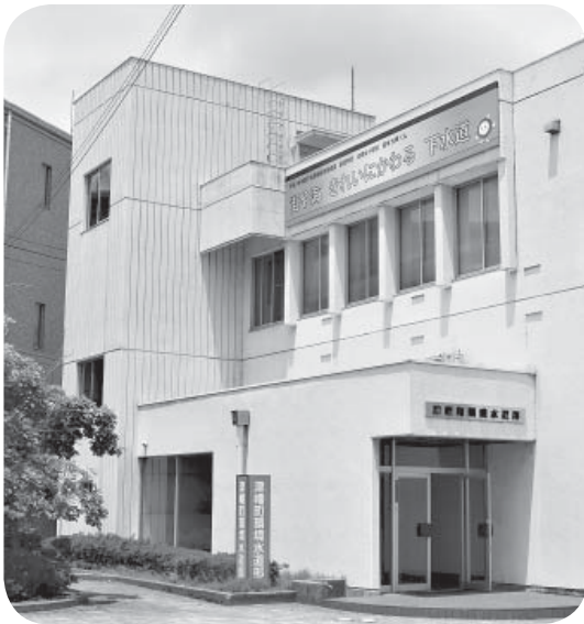
▲みんなの水の未来は？

利用料金の徴収を行う公共施設で、施設の所有権を公共主体が有したまま、施設の運営権を民間事業者に設定する方式。