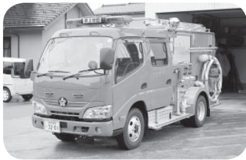
▲消防団員に若い力の確保を