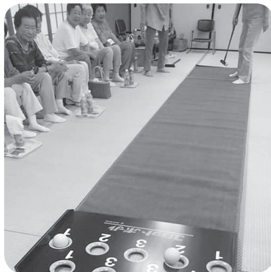
▲気分もスカッと！ (加賀爪いきいきサロン)