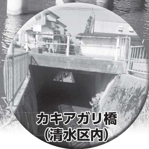
カキアガリ橋 (清水区内)