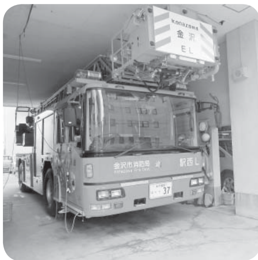
▲いざというときには津幡町にも 駆け付ける金沢市消防局のはしご車