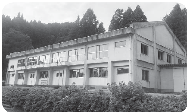
▲長い間ありがとう

当初は耐震補強による長寿命化を計画していたが、コンクリートのひび割れが進んでいることが確認されたことから、長寿命化は不適合と判断され、建て替えることとなった。