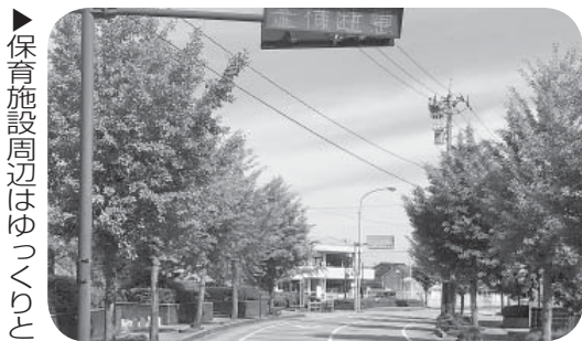
▶ 保育施設周辺はゆっくりと

保育園への送迎は、基本的に保護者が行っており、まずは保護者への交通安全指導を徹底したい。現時点では、すぐに保育園周辺をキッズゾーンとすることは考えていないが、引き続き関係機関と検討する。