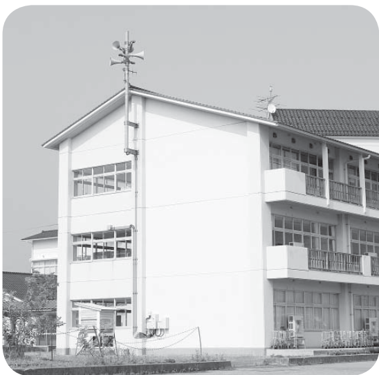
▲緊急情報は一刻も早く (井上小学校)

大規模災害などの情報をいち早く生徒に伝え、多くの命を守るために、校内放送設備と防災行政無線を連動させるようシステムを改修せよ。