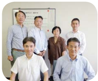
▲新メンバーで頑張ります