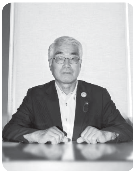
酒井 義光 議長

これから町では大きな事業が続きますが、議会としてチェック機能を発揮するとともに、活発な議論や提言を行い、協議を重ね、町の発展のために誠心誠意取り組んでいきます。 開かれた分かりやすい議会となるように、さらなる議会改革を進めていく決意です。