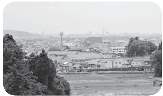
◀強くてしなやかな町へ

多発する自然災害のリスクに備えるべく、防災・減災、復旧・復興に資する地域づくりが求められている。 市町村は、地域の状況に応じた国土強靱化地域計画を総合的かつ計画的に策定し、実施する責務を有する。 策定の考えは。