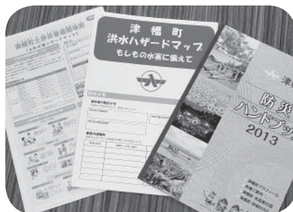
ハザードマップを確認したことがありますか？

また、豪雨の影響による土砂災害や大地震を想定したハザードマップの作成と、農業用ため池の決壊を防ぐ対策を問う。