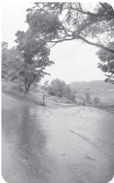
▲早期開通が待ち遠しい

現状では、活用できる国・県の補助制度がなく、大変有利な交付税措置を得られる辺地対策事業債を引き続き活用し、事業を進めていく。