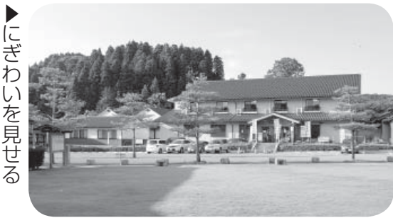
倶利伽羅塾にぎわいを見せる