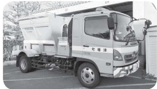
スリップ事故を防ぐために