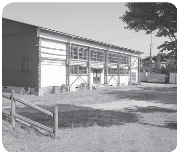
▲整備が待たれる笠野公園

笠野公園は、この地域にある唯一平地の広場である。公園にある築後54年の屋内ゲートボール場や周辺を整備することにより、災害時にはこの地が避難場所など防災拠点になり得ると考える。近くに笠谷消防分団があることも有効である。町の将来計画としての考えを示せ。