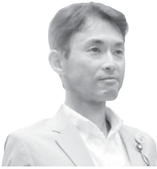
竹内 竜也 議員