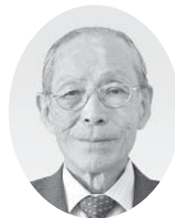
洲崎 正昭 議員