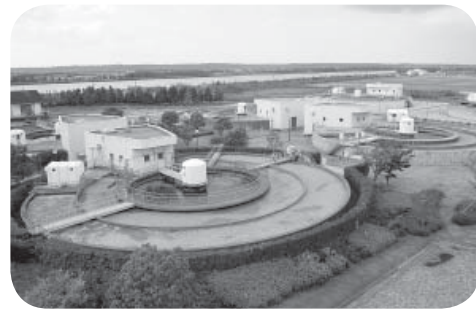
◀運営はどう変わる? (町浄化センター)

上下水道官民連携事業 について検討した結果、 町が所有権を持ったまま 民間が運営権を取得する 方式でなかったことは評 価できるが、包括的民間 委託に不安は残る。 役場に技術の継承はで きるのか。 また、災害時の復旧に 支障はないのか。