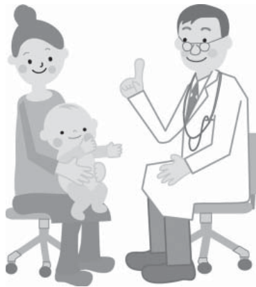
▲迷わず受診できるように

子育て世代の方々に、 子どもの医療費の支払い が500円になったこと の感想を尋ねると「お金 の心配をせずに医者にか かれてうれしい」と言わ れた後で、ほとんどの方 が「なぜ津幡町は無料に ならないのか」と問われ た。 県内19自治体のうち、 無料でないのは6自治体 である。なぜ窓口無料化 に取り組まないのか。