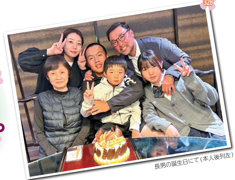
長男の誕生日にて(本人後列左)