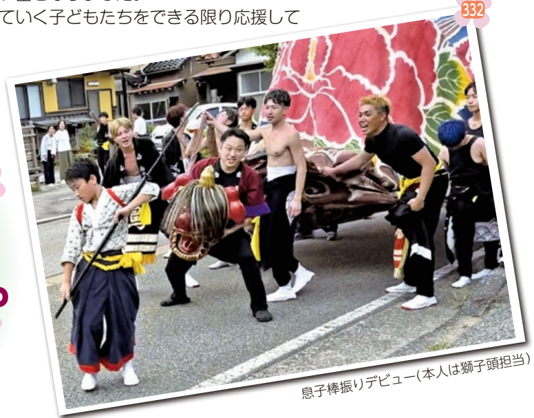
息子棒振りデビュー(本人は獅子頭担当)