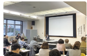
写真は昨年の様子です

12月19日に役場で開催された「権利擁護研修会」の様子をお送りします。 障がいの有無に関わらず、ひきこもりなどの生きづらさを抱えた子を持つ親自身が病気が判断能力の低下、亡くなった後、子どもが自立した生活を送るにはどうすればいいか。みなさんの身近にある成年後見制度のしくみや財産管理の制度を知り、自分や家族のこの先のことについて一緒に考えてみませんか。