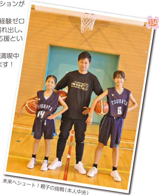
未来へシュート! 親子の挑戦(本人中央)