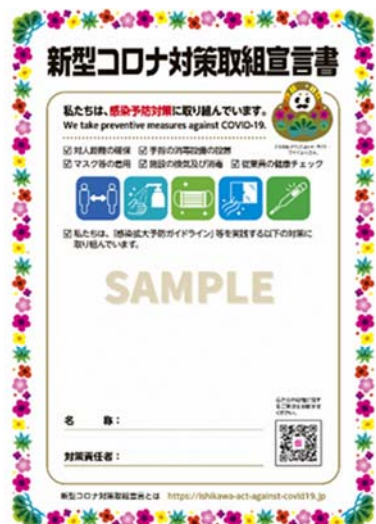
新型コロナ対策取組宣言書

また、「 いしかわ新型コロナ対策認証制度 」の認証を取得した事業者は、 認証書の写し を併せて提出してください。