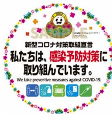
新型コロナ対策取組宣言書 ステッカー