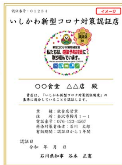
「いしかわ新型コロナ対策 認証制度」認証書